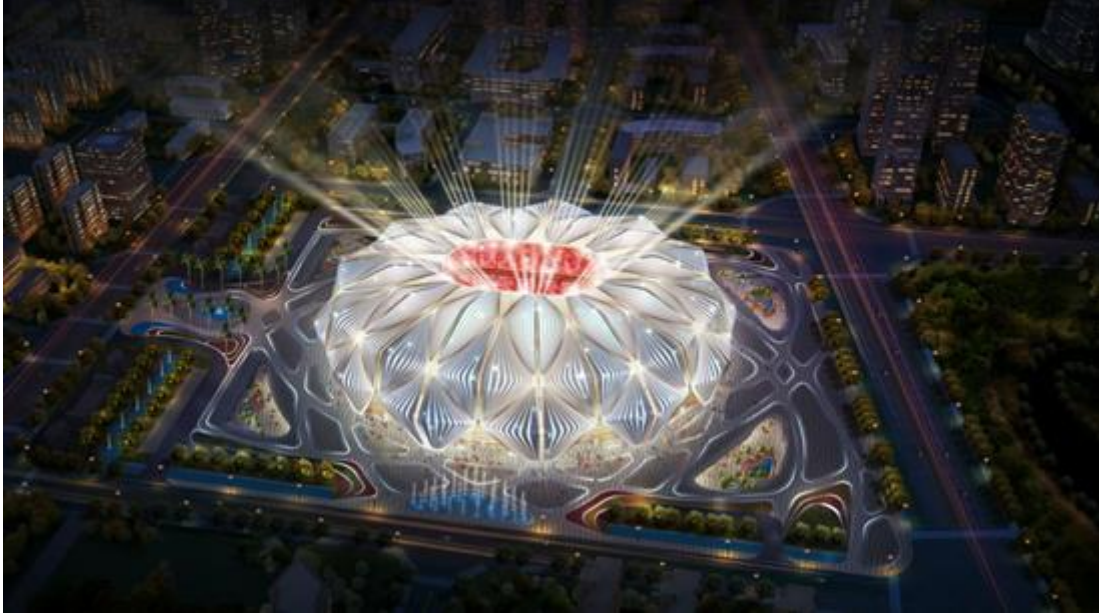
恒大集团广州足球场灯光秀效果图

报告期内实现营业收入19,083.68万元，比去年同期增长13.38%，占主营业务收入比重从18.54%提高到19.40%，保持了稳定增长。报告期内公司完成了太原市长风商务区内河景观提升、南通市紫琅公园紫琅湖光影水秀和恒大集团广州足球场灯光秀等项目。