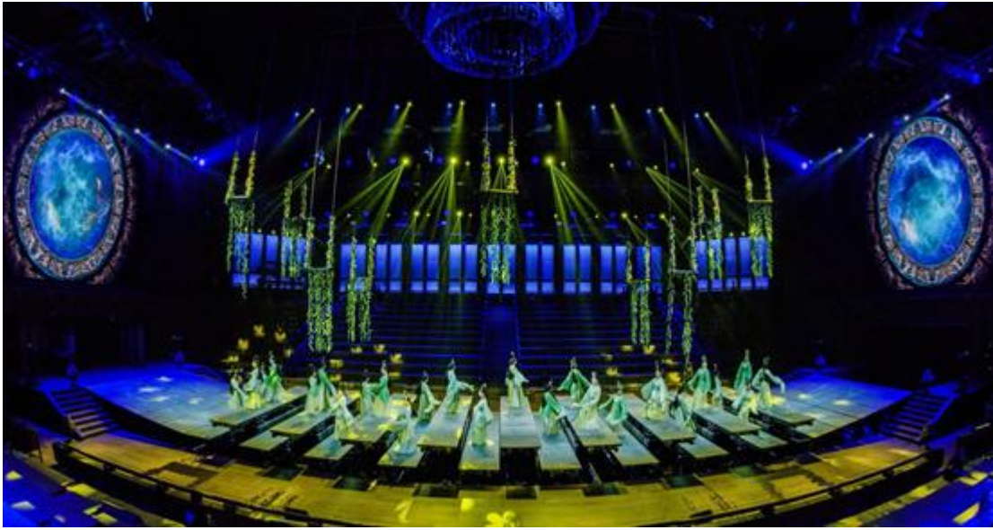
山东曲阜大型室内剧场演出《金声玉振》