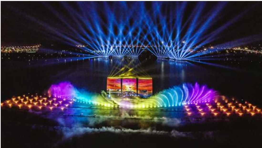
南通市紫琅公园紫琅湖光影水秀