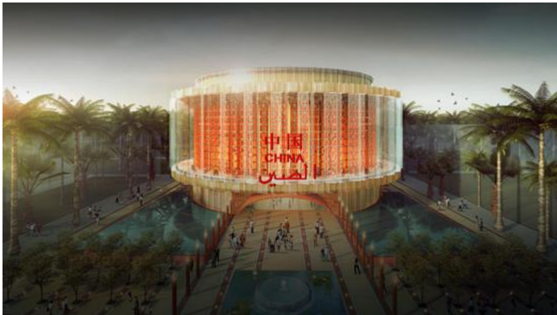
2020年迪拜世博会中国馆效果图

面对上述严峻形势，公司在借助国家级大型文艺演出市场经验基础，积极拓展商业演出市场。由公司承接的湖南卫视2020-2021跨年演唱会已圆满落幕，收视六网全域第一。此次跨年演唱会是公司与湖南卫视的首次合作，也是首次完全由中国团队全程参与的创意之作，展示中国舞美的新兴力量。