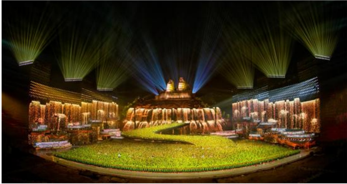
2020年央视春晚郑州分会场