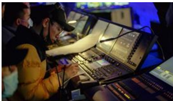
灯光总设计王邢磊