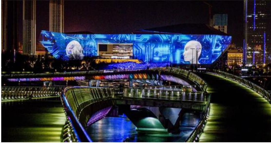
太原市长风商务区内河景观提升