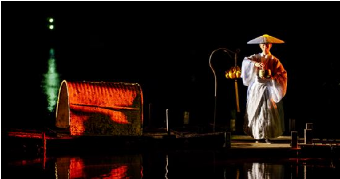
江苏无锡灵山拈花湾禅意小镇禅文化体验

在2019年郑州第十一届少数民族运动会和2020年央视春晚郑州分会场等大型文艺演出圆满成功的基础上，2020年4月，郑州锋尚世纪文化旅游发展有限公司的成立，标志着公司准备进一步深耕河南文化旅游演艺市场。2020年7月成立郑州黄河颂演艺有限公司，更迈出了涉足文化旅游演艺商业运营的第一步。