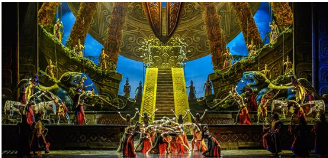
大型情景史诗剧《梦回巴国》