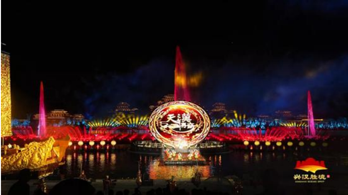
大型汉文化水上实景演艺《天汉传奇》

报告期内实现营业收入66,587.91万元，比去年同期增长113.29%，占主营业务收入比重从34.39%提高到67.68%，文化旅游演艺板块成为公司营业收入的绝对主力。旅游景区一方面受到了新冠疫情爆发的巨大冲击，另外一方面在疫情期间也在积极完善和更新演出内容，加大投入。公司作为文化旅游演艺内容的提供者，获得了良好的市场机会。报告期内公司完成了陕西汉中大型文化史诗长歌《汉颂》与大型汉文化水上实景演艺《天汉传奇》、大型情景史诗剧《梦回巴国》和陕西西安大型水舞光影秀《大唐追梦》等文化旅游演艺项目。