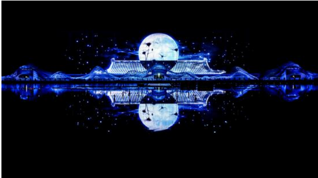
大型水上实景演出项目《如梦晋阳》

十一期间，公司承制的陕西西安大型水舞光影秀《大唐追梦》、陕西汉中大型文化史诗长歌《汉颂》和大型汉文化水上实景演艺《天汉传奇》、山西太原大型水上实景演出《如梦晋阳》、山东曲阜大型室内剧场演出《金声玉振》、江苏无锡灵山拈花湾禅意小镇禅文化体验和四川达州大型巴文化情景史诗剧《梦回巴国》等常规运营类项目引来无数游人，这些项目不仅展现出国内文旅市场的生机与活力，也体现了公司近年来在文化旅游演艺项目的品质。2020年11月5日，2020中国旅游演艺大会评选了“2019年中国实景旅游演艺十强”和“2020年疫后旅游演艺复演先锋”，公司承制的《最忆是杭州》和《大唐追梦》分别入围。