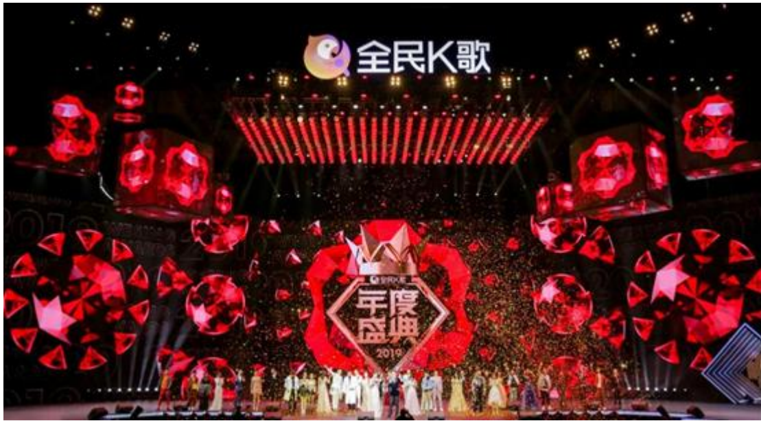
2019全民K歌年度盛典颁奖晚会