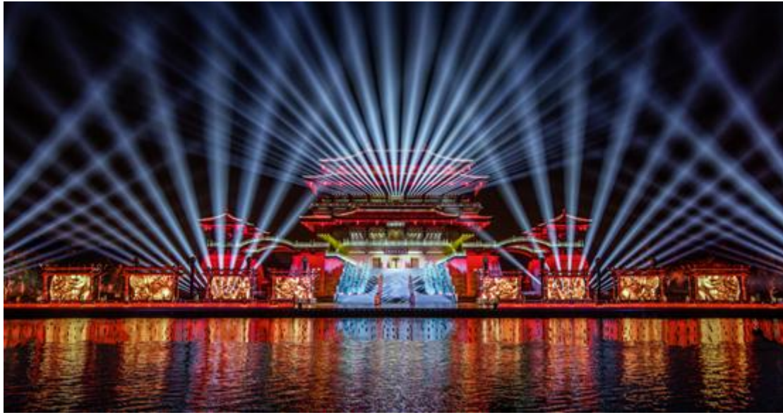
西安大型水舞光影秀《大唐追梦》

十一期间，公司承制的陕西西安大型水舞光影秀《大唐追梦》、陕西汉中大型文化史诗长歌《汉颂》和大型汉文化水上实景演艺《天汉传奇》、山西太原大型水上实景演出《如梦晋阳》、山东曲阜大型室内剧场演出《金声玉振》、江苏无锡灵山拈花湾禅意小镇禅文化体验和四川达州大型巴文化情景史诗剧《梦回巴国》等常规运营类项目引来无数游人，这些项目不仅展现出国内文旅市场的生机与活力，也体现了公司近年来在文化旅游演艺项目的品质。2020年11月5日，2020中国旅游演艺大会评选了“2019年中国实景旅游演艺十强”和“2020年疫后旅游演艺复演先锋”，公司承制的《最忆是杭州》和《大唐追梦》分别入围。