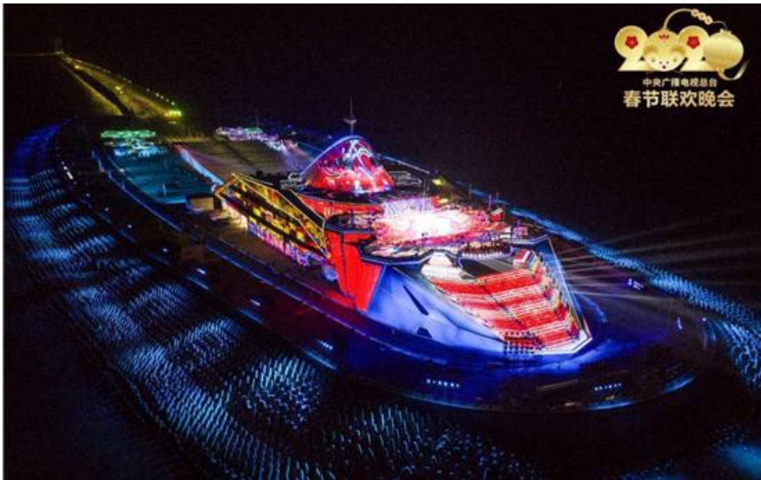
2020年央视春晚珠海分会场